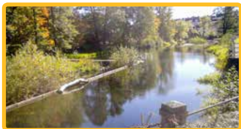
Reumatikerföreningen Mjölby-Skänninge sida 14