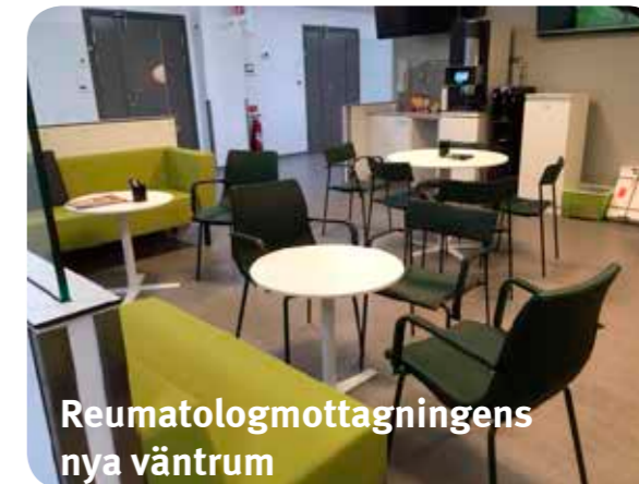
Reumatologmottagningens nya väntrum

Funktionsrätt Östergötlands Ordförandemöte utgör referensgrupp till brukarråden.