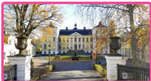
Reumatikerföreningen Finspång sida 18