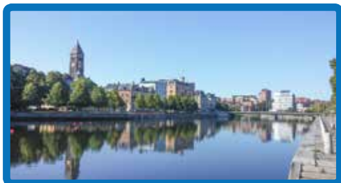
Reumatikerföreningen Norrköping sida 8-11