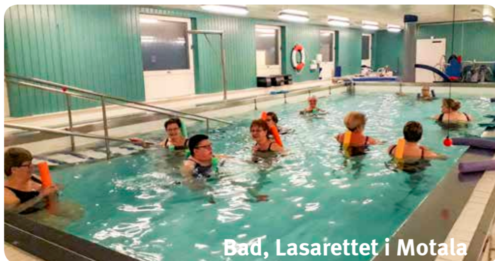
Bad, Lasarettet i Motala

Anmäl alltid specialkost och födoämnesallergi. Använd ej starka parfymer på möten och resor. Fotografering kan förekomma i verksamheten, meddela om du inte vill medverka på bild.