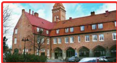
Reumatikerföreningen Linköping sida 12-13