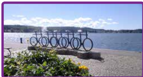
Reumatikerföreningen Motala-Vadstena sida 15-17