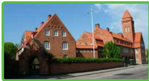
Distriktet Östergötland sida 2-7