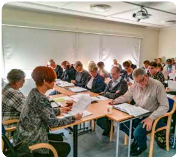
Stämmodeltagare